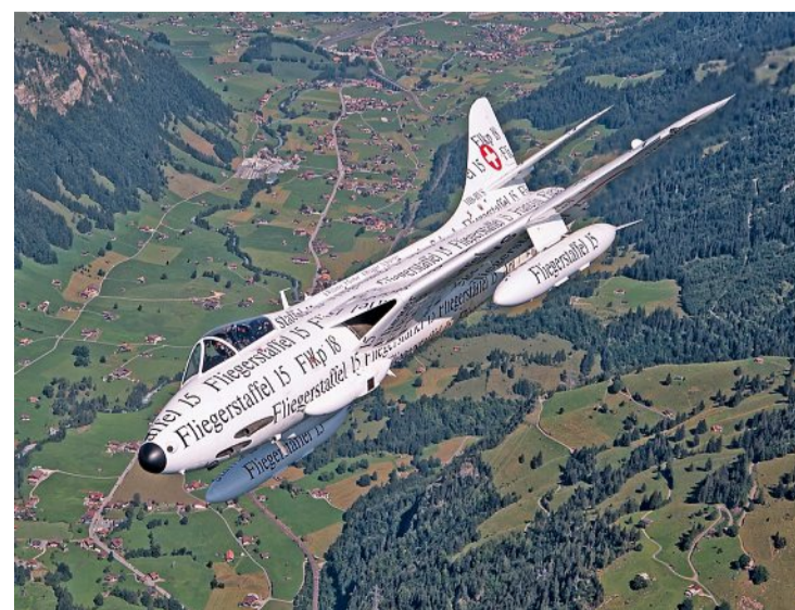
Der Papyrus-Hunter darf beim Jubiläum des Flugplatzfests St. Stephan nicht fehlen.